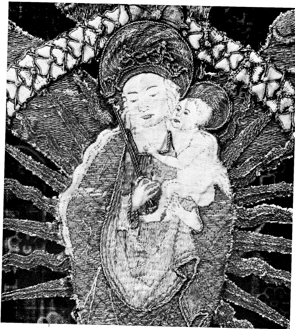
Fig 119. Detalj av mäss- haken fig 118. Foto 1965. Detail of chasuble, fig 118.

med granatäpplemönster, Italien, 1400-talets senare hälft. Snittet är medeltida utan axelsömmar; framstycket smalt och med många skarvar. På ryggsidan är applicerat ett broderat kors med i korsmitten Maria med Jesusbarnet inom en rosenkrans. Broderiet är utfört med mångfärgat silke i atlassöm samt membranguld i läggsöm; detaljer i sidenapplikation. Ryggsidan höjd 115 cm, bredd 82 cm, framsidan höjd 88, bredd 50.